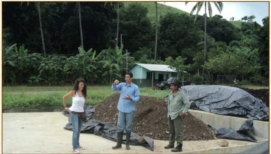
Planta de compostaje. El Salvador

¡Qué indecencia! Qué cortedad de miras, qué visión política del mundo, qué conocimiento, o mejor dicho, desconocimiento de los Derechos Humanos. Y como la gota de agua que va horadando la piedra, así en la sociedad hemos ido perdiendo la sensibilidad y la empatía que, en otros momentos, nos ha hecho vibrar y reivindicar un mundo mejor y posible.