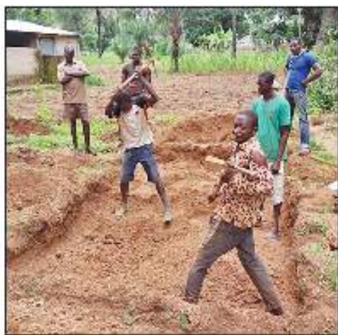
Limpieza de los terrenos e inicio de las excavaciones

Cuando finalizaron la construcción de los pozos surgió la idea de levantar un taller de artesanos y obreros, la posibilidad de una tienda "estable" para los vendedores ambulantes o unos molinos para moler maíz y no machacarlo a mano. Para todo ello la comunidad contó con la colaboración de la ONG que tra-