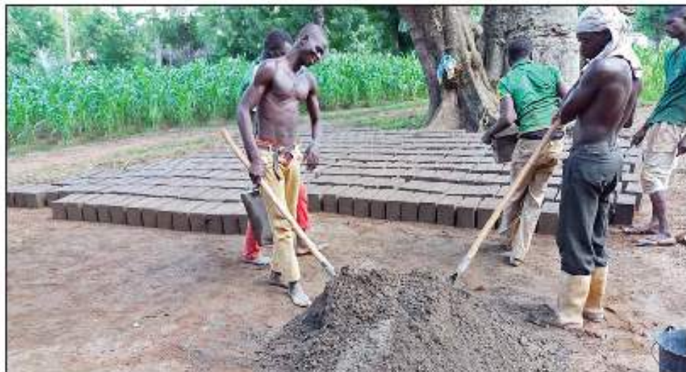
Elaboración de adobes para la construcción de las letrinas

Con la mejora de la higiene y supresión de las aguas fecales se puede evitar hasta un 80% de las enfermedades de la población