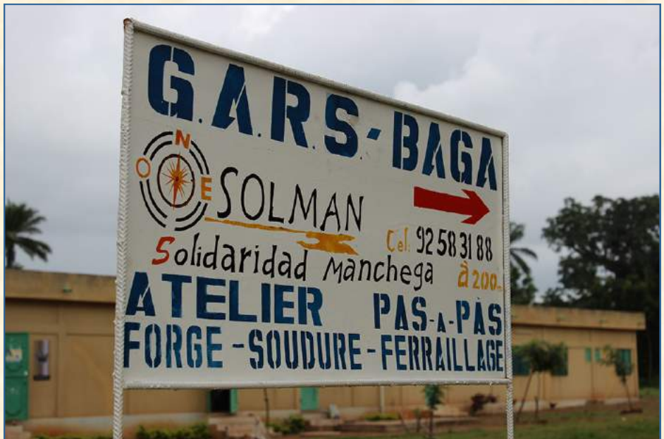
Grupo de artesanos rurales. Togo

Nos hemos vuelto más provincianos y no vemos más allá de nuestras pequeñas fronteras. No sé si no somos conscientes o no queremos serlo de que, hoy día, cualquier acontecimiento que pase en cualquier parte del mundo, nos atañe y, en su medida correspondiente, somos responsables de ello. Dicho de otro modo, el hambre, la pobreza, las injusticias, la mortalidad infantil, la violencia de género y todos los grandes desafíos que padecen en cualquier lugar del planeta la mayor parte de la población mundial, también es cosa nuestra y somos, en la medida que fuere, responsa-