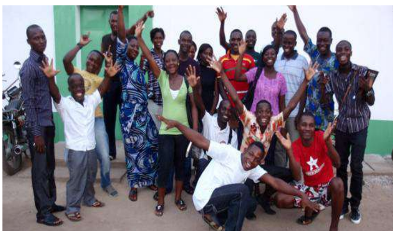
Alumnos de la Maison Baobab