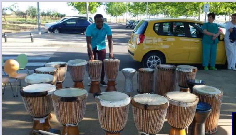
Taller de percusión con niños del Hospital 3/5/17