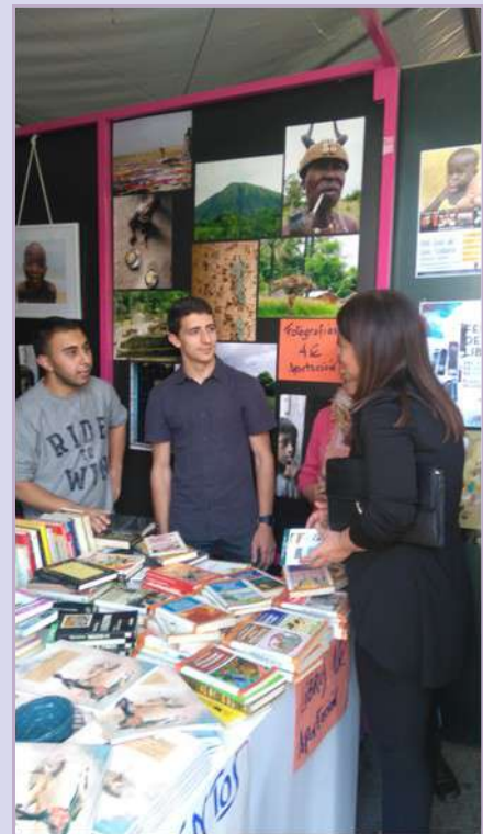
Ilustre visitante (Feria del libro)