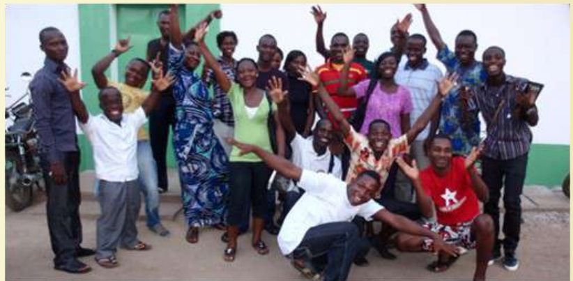
Universitarios becados en Togo

Os recordamos que una forma de colaboración directa es apoyar a jóvenes universitarios de Togo y Nicaragua con aportaciones directas para este fin, la valoración de cada beca es de 450 € cada una para cada año. La educación es una de las principales herramientas para el desarrollo.