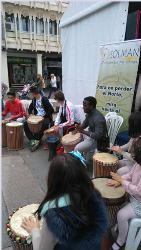
Feria del Libro 23/4/17