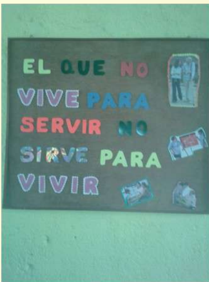
Biblioteca de "La Palmera" Nicara-

Os recordamos que una forma de colaboración directa es apoyar a jóvenes universitarios de Togo y Nicaragua con aportaciones directas para este fin, la valoración de cada beca es de 450 € cada una para cada año. La educación es una de las principales herramientas para el desarrollo.