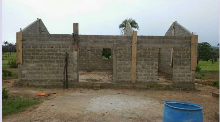
Grupo de mujeres, proyecto "Mostaza"